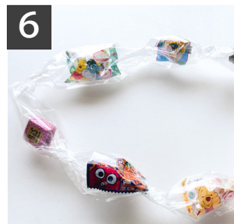
6 これを繰り返し真ん中から左右に4個ずつ入れたら輪にしてセロテープでしっかり留める。