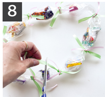
8 リボンの長さをバランス良くカットする。