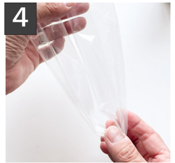
4 筒の真ん中を絞ってセロテープで留める。