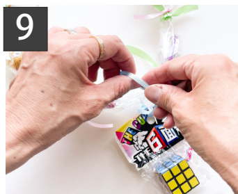
9 おもちゃをリボンでメダルのように結んだら出来上がり。