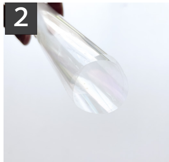
2 フィルムを直径6cm(お菓子が入る位)ほどの筒になるよう丸める。