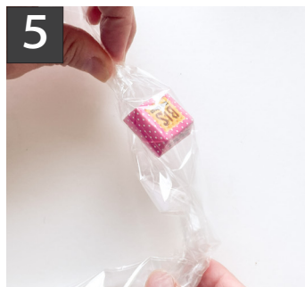
5 筒の端からお菓子を1個入れ、真ん中まで滑らし、セロテープで留める。