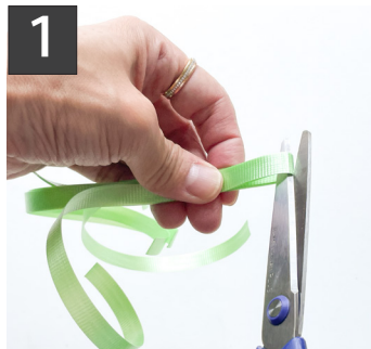
1 リボンをそれぞれ8等分にカットする。

筒にしたセロファンにお菓子を包み、リボンでとめておもちゃを付けたレイを作ります。 小さなお子様にも簡単に楽しく作っていただけます。