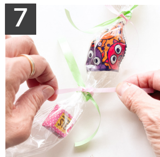
7 セロテープの上から2色のリボンを1本ずつをかた結びして飾っていく。