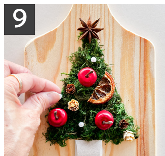
9 最後にビーズにボンドを付け飾りつけます。