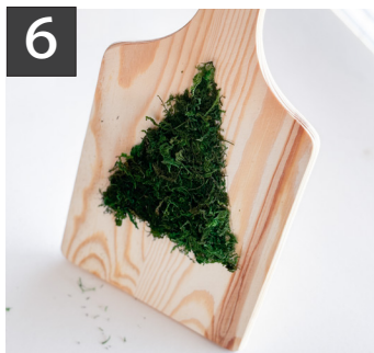
6 木製ボードを立てて、余分な苔を落とします。