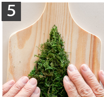
5 乗せ終わったら形を整え、指の腹で軽く押し付けます