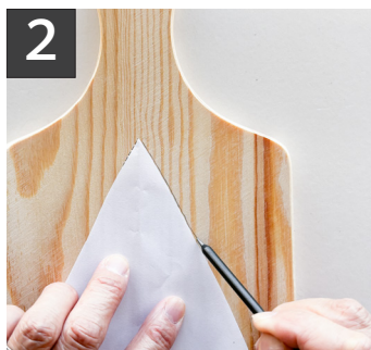
2 木製ボードに型紙を置き鉛筆でなぞります。