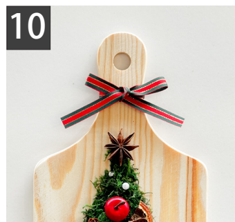
10 リボンを持ち手などに、飾って出来上がり