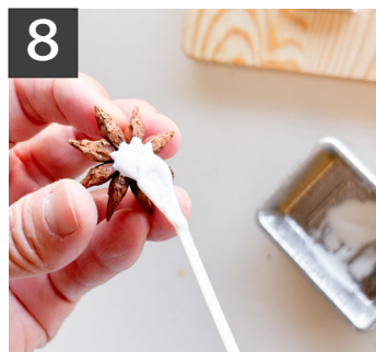
8 マドラーで花材にボンドを付けて、苔の上に飾りつけます。