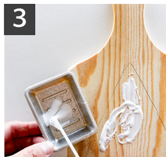
3 型紙を外し、ボンドを少し多めに塗ります。