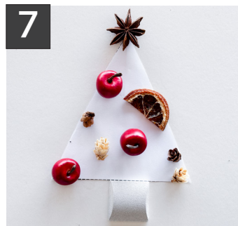
7 苔を乾かしながら型紙の上に花材の配置をデザインします。